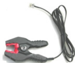
PINCE DE LECTURE

Vos IBees peuvent être lus et programmés avec les logiciels Thermotrack (PC, Online, Webservice) grâce à la pince de lecture et son adaptateur USB