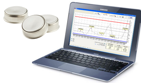
Fonctionne avec l'ensemble des Thermo Boutons

Branchez le bouton sur le lecteur et obtenez directement la courbe, la liste des températures, la liste des dépassements de seuils critiques.